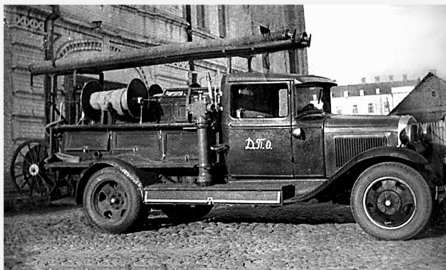
Пожарная машина ГАЗ, модель 1

Грандиозность строительства первых пятилеток и требование государства в обеспечении пожарной безопасности объектов дали толчок к созданию новой пожарной техники, эффективной организации пожаротушения. На вооружении пожарных команд, помимо традиционных линеек и автонасосов, карет скорой помощи и других, появились автоцистерны, вспомогательные ходы, включающие освещение и связь, технику дымоудаления, пенотушения, подъемного оборудования, для перевозки замерзших рукавов. Были запущены предприятия, выпускающие всю номенклатуру пожарно-технической продукции. Началась планомерная подготовка инженерно-технических кадров, стала набирать силу пожарная наука.