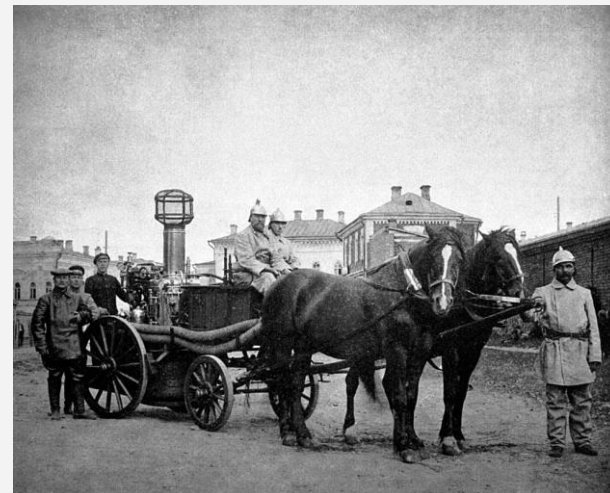
Конный ход пожарного обоза 1-ой части Симбирска с паровой машиной