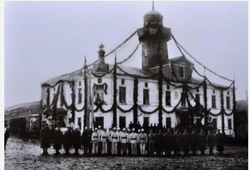
Дмитров, пожарная команда, каланча