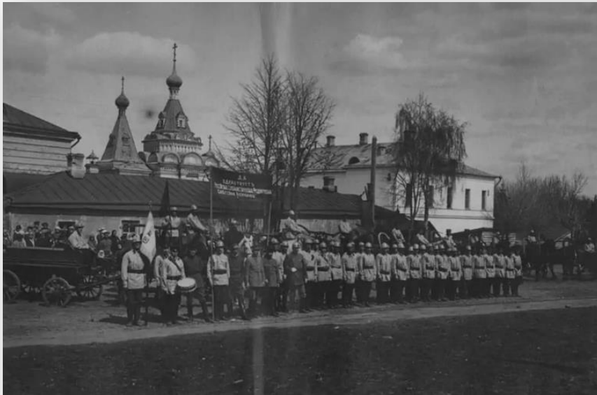
Смотр пожарной охраны 1919 год Дмитров

Согласно "Нормальной табели составу пожарной части в городах" от 1853 года, в Дмитрове пожарная команда имела 4 повозки для доставки заливных труп, 7 лошадей, 2 линейки для перевозки пожарной команды, 8 бочек и 4 повозки для перевозки багров и лестниц.