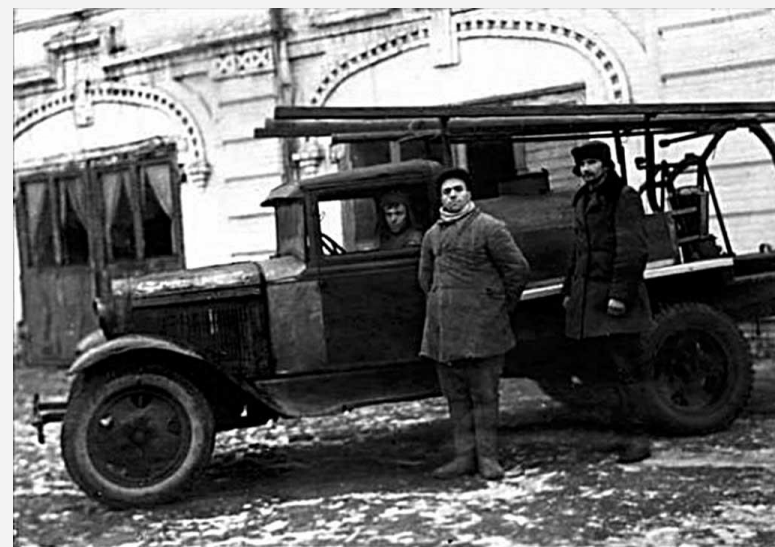
Грузовой автомобиль ГАЗ-АА, переоборудованный под пожарную автоцистерну.