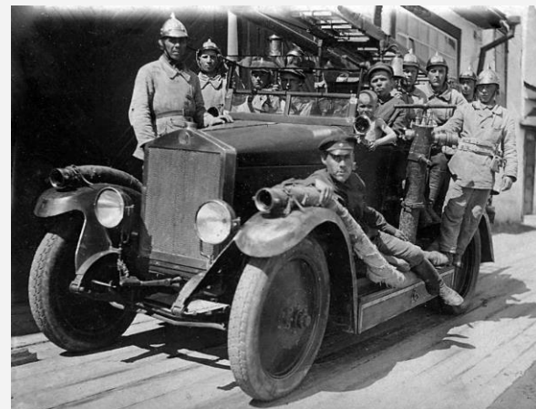
Боевой расчет пожарной команды 1920-х годов