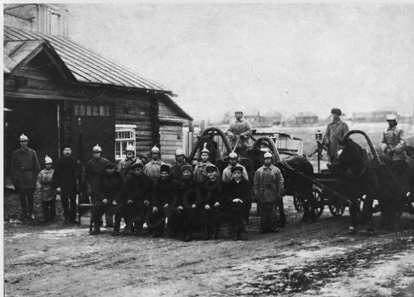
Члены добровольной пожарной дружины